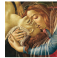
Sandro Botticelli (1445–1510): Beweinung Christi (Detail)